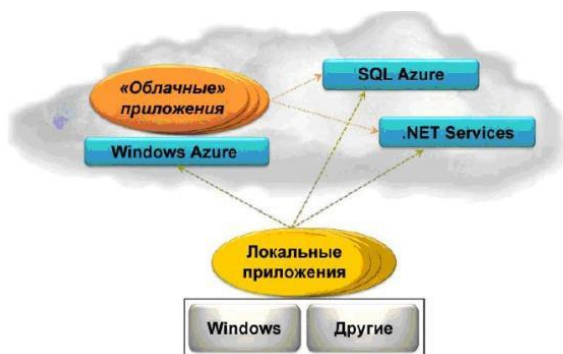
Рисунок 2 - Платформа Windows Azure поддерживает приложения, данные и инфраструктуру, находящиеся в "облаке"

На высоком уровне понять Windows Azure очень легко. Это платформа для выполнения приложений Windows и хранения их данных в Интернете ("облаке"). На рисунке 2 показаны ее основные компоненты.