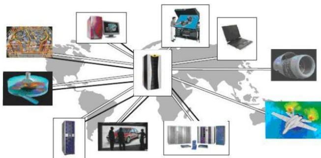
Рисунок 1 - Грид вычисления

Изменяет экономику вычислений, позволяя клиентам платить только за используемые ресурсы;